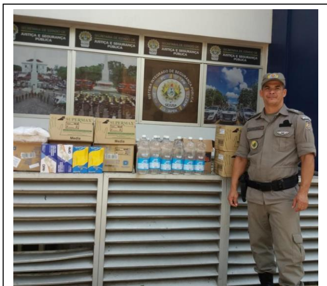
Foto 7 – Entrega de Equipamentos Individuais de Proteção aos Policiais Militares.