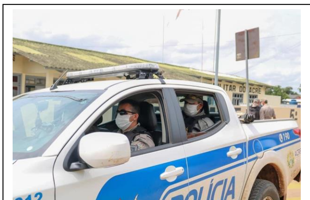
Foto 9 – Policiais equipados e protegidos para o policiamento ostensivo e preventivo.