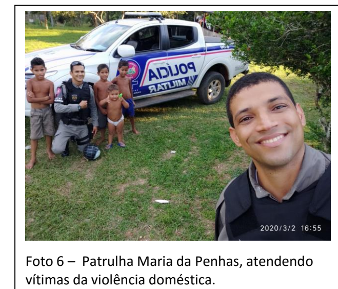
Foto 6 – Patrulha Maria da Penhas, atendendo vítimas da violência doméstica.